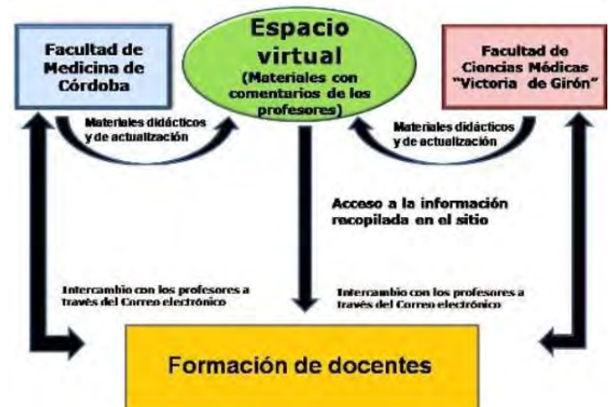
Fig. 1. Intercambio colaborativo entre las Facultades de Medicina para la formación de los docentes.

Los profesores de las dos universidades colocarían en el sitio material de didáctica y de actualización, ejemplos, como los modelos celulares, tisulares y de órganos e interpretación de imágenes, entre otros, con comentarios adjuntos sobre los mismos. Los temas contarían con una guía de estudio y con preguntas de autoevaluación. Los que visiten el sitio, se podrán comunicar en todo momento con los profesores a través del correo electrónico para la aclaración de dudas. Los materiales se expondrán en el sitio, en PDF para poder ser descargados por los interesados (Fig.1).