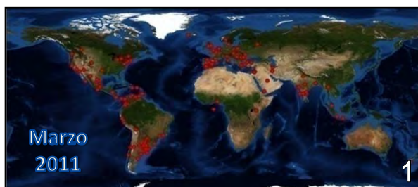
Figs. 1 y 2. Evolución en la Distribución de visitas al sitio web de la revista: www.anatomia-argentina.com.ar/revistadeanatomia.htm .

La Anatomía fue, es y será una de las materias fundamentales para entender la estructura del cuerpo humano y sobre ella edificar los conocimientos de la función normal y patológica, a partir de los cuales se estructuran las terapéuticas de los males que nos aquejan.