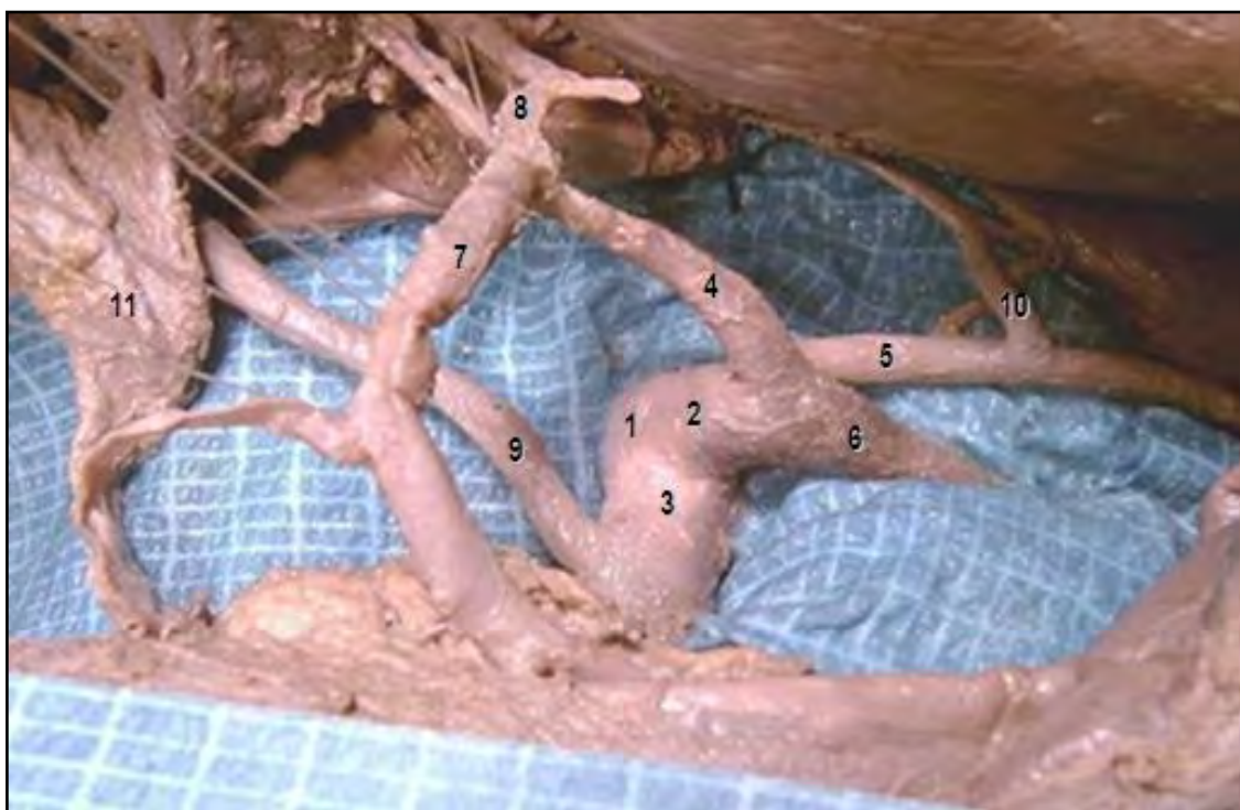
Fig. 1. 1. Tronco celiacomesentérico; 2. Tronco celiaco; 3. Arteria Mesentérica Superior; 4. Arteria Hepática Común; 5. Arteria Gástrica Izquierda; 6. Arteria Esplénica; 7. Arteria Gastroduodenal; 8. Arteria Hepática Izquierda; 9. Arteria Hepática Aberrante Derecha Reemplazante; 10. Arteria Hepática Izquierda Aberrante Accesoría; 11. Conducto Colédoco.

Tandler (8) propuso una disposición metamérica de las arterias del tronco. En el embrión, cada nivel metamérico da lugar a tres pares de arterias que nacen de la aorta: las posteriores son parietales, las laterales son urogenitales, y las anterior son intestinales. Tandler demostró en embriones humanos que las arterias intestinales metaméricas primitivas (arterias vitelinas) están conectadas por una anastomosis longitudinal anterior. Es decir, cuatro ramas espláncnicas primitivas derivadas de la aorta abdominal en embriones humanos están conectados por una anastomosis longitudinal ventral (Laengsanastomose) entre los cuatro raíces de la arteria onfalomesentérica, de las cuales las dos centrales desaparecen y el conducto longitudinal anastomótico se une a las raíces primera y cuarta. Las arterias gástrica izquierda, hepática común y esplénica se originan en esta anastomosis longitudinal. Por lo tanto, es la persistencia o desaparición de distintas porciones de este primitivo plexo arterial lo que determinaría la aparición de numerosas variaciones anatómicas del TC y la AMS. Esta última se origina, por lo general, de la cuarta raíz por debajo de la última de estas tres ramas celiacas. Si esta separación se lleva a cabo a un nivel superior, una de las ramas