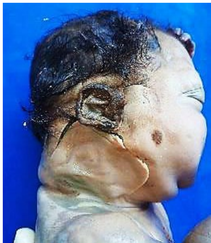
Fig. 2: Incisión de Appiani modificada