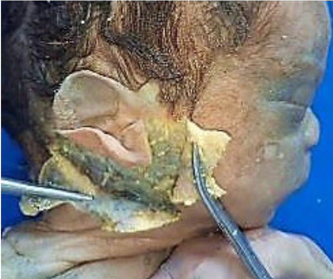
Fig. 3: Diseción por planos

Identificación del nervio Facial: El tronco nervioso del VII par se identifica a nivel de su salida por el agujero estilomastoideo teniendo en cuenta las referencias que existen para la identificación del nervio de forma fiable y reproducible :